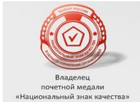
Владелец почетной медали «Национальный знак качества»