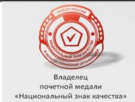
Владелец почетной медали «Национальный знак качества»