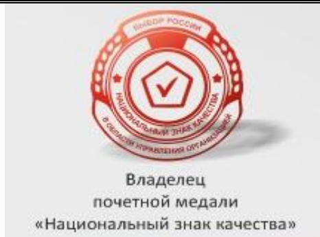
Владелец почетной медали «Национальный знак качества»